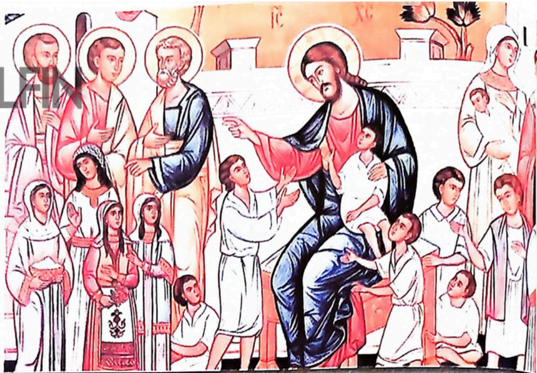
Mântuitorul binecuvântând copiii

a propovădui = a predica; a răspândi învățături religioase.