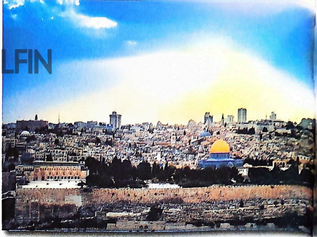
Vedere a Ierusalimului în prezent

monoteist = care crede într-un singur Dumnezeu.