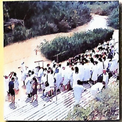
Pelerini la râul Iordan

Suflete, scoli și cunoaște Luminos Prunc că Se naște În peștera inimii, în pala- tul Treimii. Dară Pruncul Cine mi-i? Mi-e Hristosul Dumnezeu Coborât în pieptul meu.