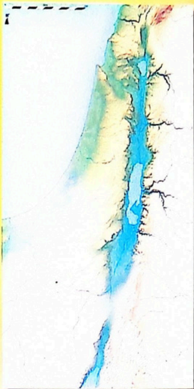
Relieful Țării Sfinte