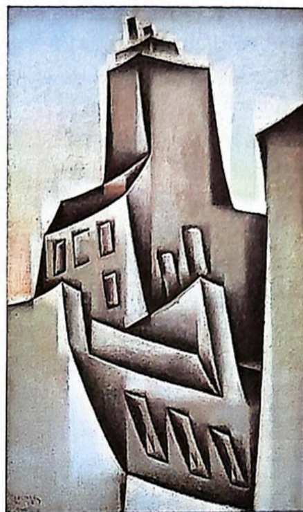
Juan Gris, Case din Paris

6. Învățătorul și colectivul clasei vor premia cele mai frumoase lucrări.